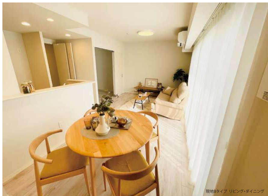
現地Bタイプ リビング・ダイニング