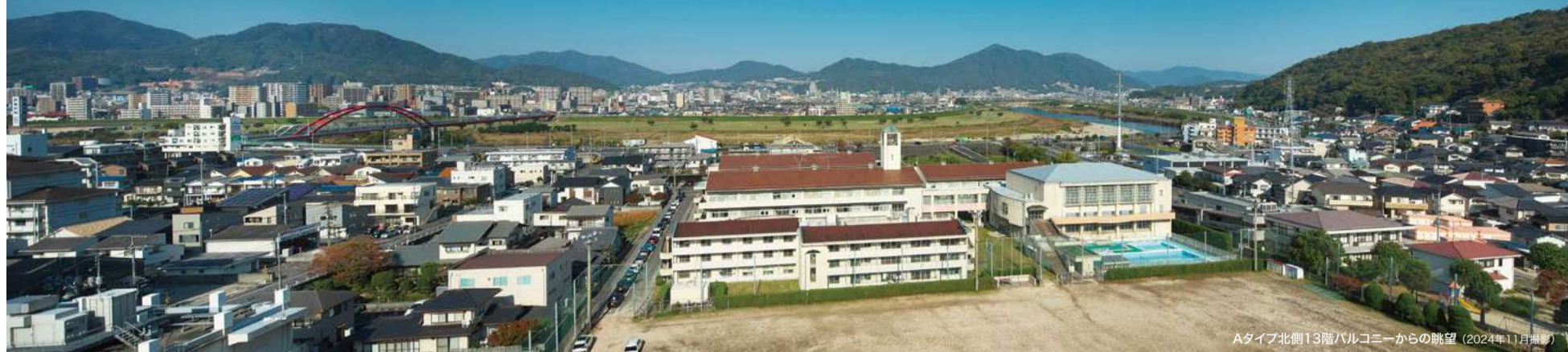
Aタイプ北側13階バルコニーからの眺望 (2024年11月撮影)