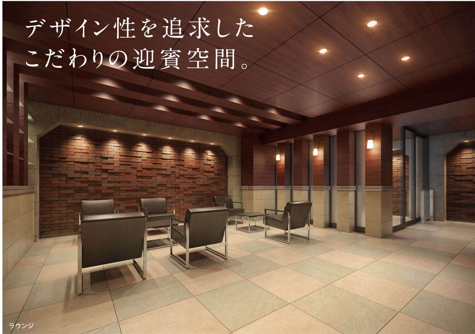
※エントランスホール・ラウンジ完成予想図は、計画段階の図面を基に描き起こしたもので、実際のものと異なります。